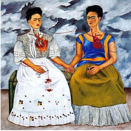
Les deux Frida, huile sur toile, 173cm x 173cm, 1939, Musée d'art moderne, Mexico.