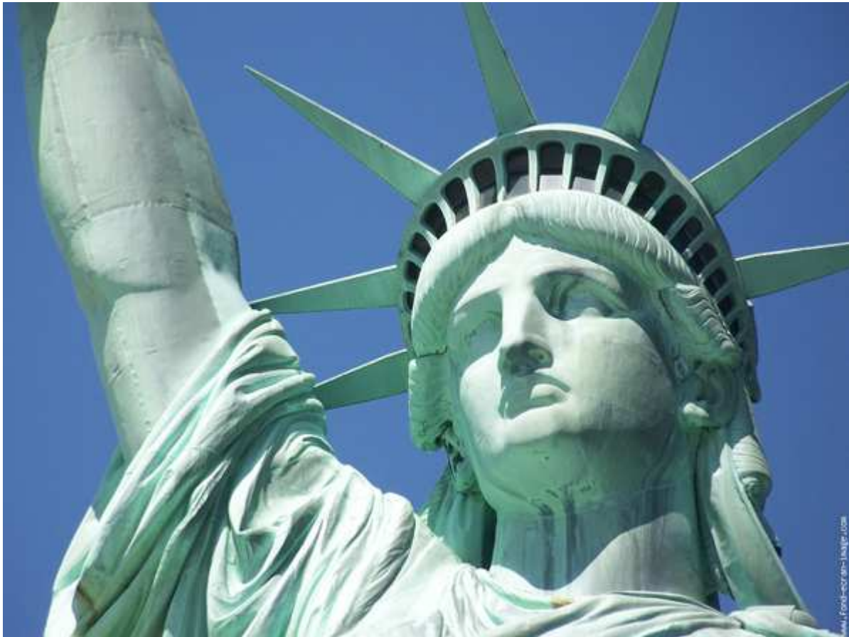
La Liberté illuminant le monde, Auguste Bartholdi